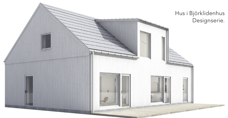
Hus i Björklidenhus Designserie.