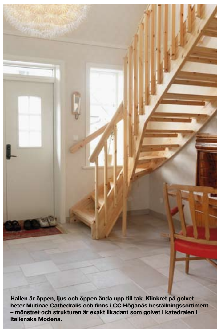
Hallen är öppen, ljus och öppen ända upp till tak. Klinkret på golvet heter Mutinae Cathedralis och finns i CC Höganäs beställningssortiment – mönstret och strukturen är exakt likadant som golvet i katedralen i italienska Modena.