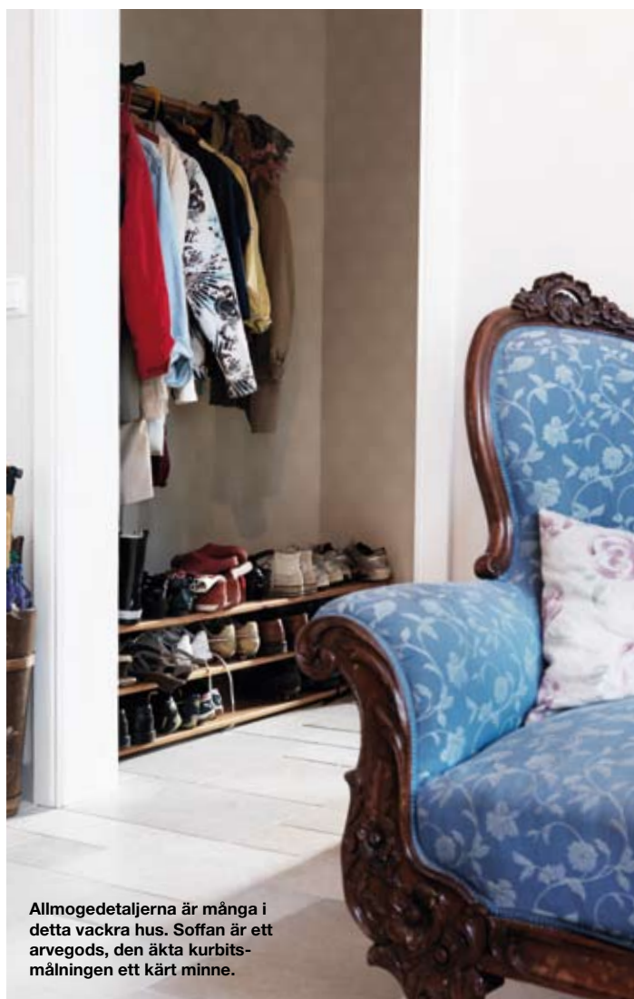
Allmogedetaljerna är många i detta vackra hus. Soffan är ett arvegods, den äkta kurbitsmålningen ett kärt minne.